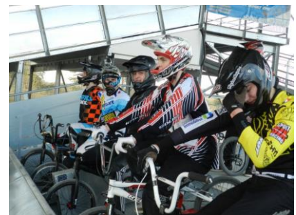
Stage Saint Quentin (cafétéria, consignes, start)