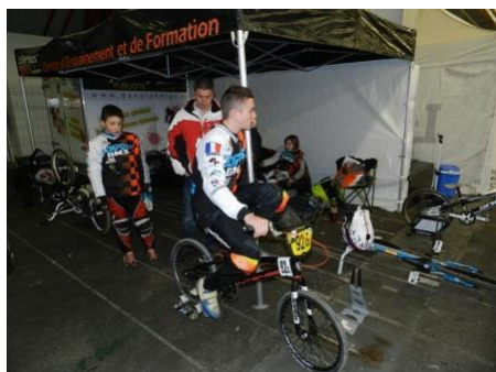
Indoor de Saint Etienne

* "Prestations comprises dans la prise en charge du pilote"