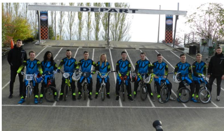
Les pilotes du centre d'entrainement et de la DN 2016-2017